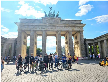
Der Start unterm Brandenburger Tor