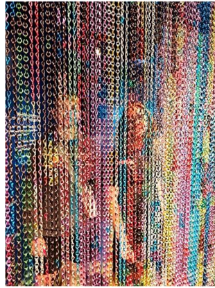
Gott sah, dass das Licht gut war.....