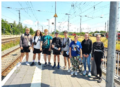
Ohne Hals- und Beinbruch Zuhause