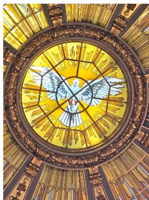
Heilig-Geist-Kuppel im Berliner Dom