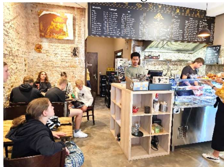
Stärken beim Sudanesen