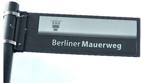
160 km lang