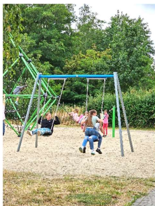
Spielen auf dem ehemaligen Todesstreifen