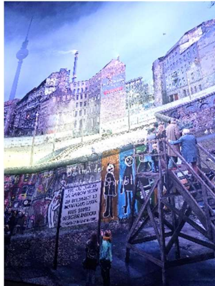
Asisi Panorama „Die Mauer“