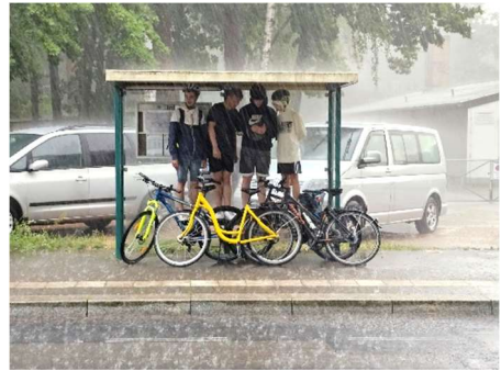
In Potsdam angekommen: Regen, Regen, Regen, Regen