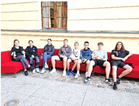
Auf dem Roten Sofa im jüdischen Museum