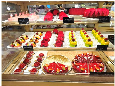
Bummeln im KaDeWe