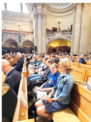
Gottesdienstbesuch im Berliner Dom