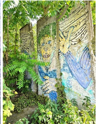
Gedenkstätte Bernauer Str. Ein Engel für Ben