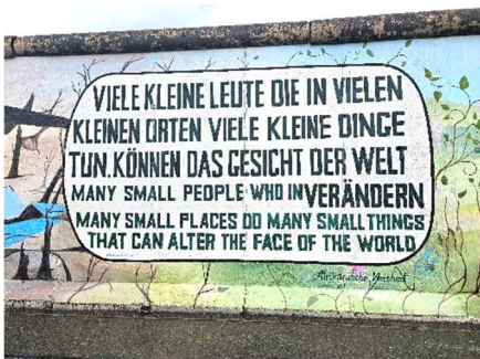
East Sid Gallery