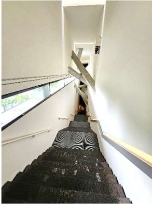
Im jüdischen Museum von Daniel Liebeskind