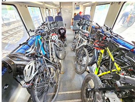
Glücklich einen Fahrradplatz ergattert