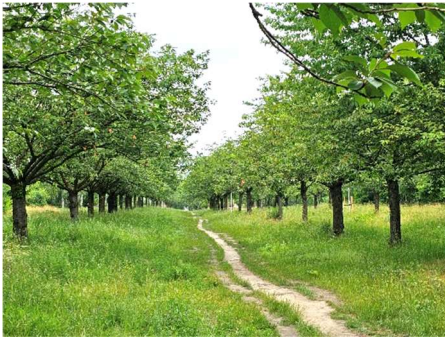
800 Kirschbäume gestiftet von japanischen Bürgern aus Freude über die Wiedervereinigung